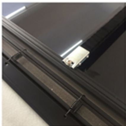
vysoce kvalitní rám