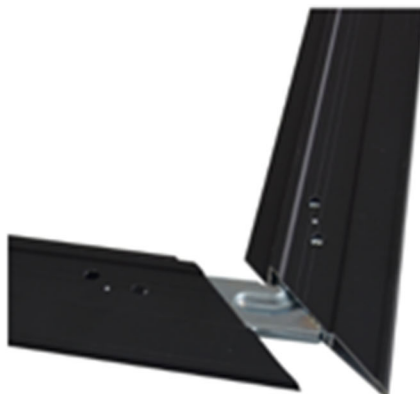
45° rohová spojovací konzola